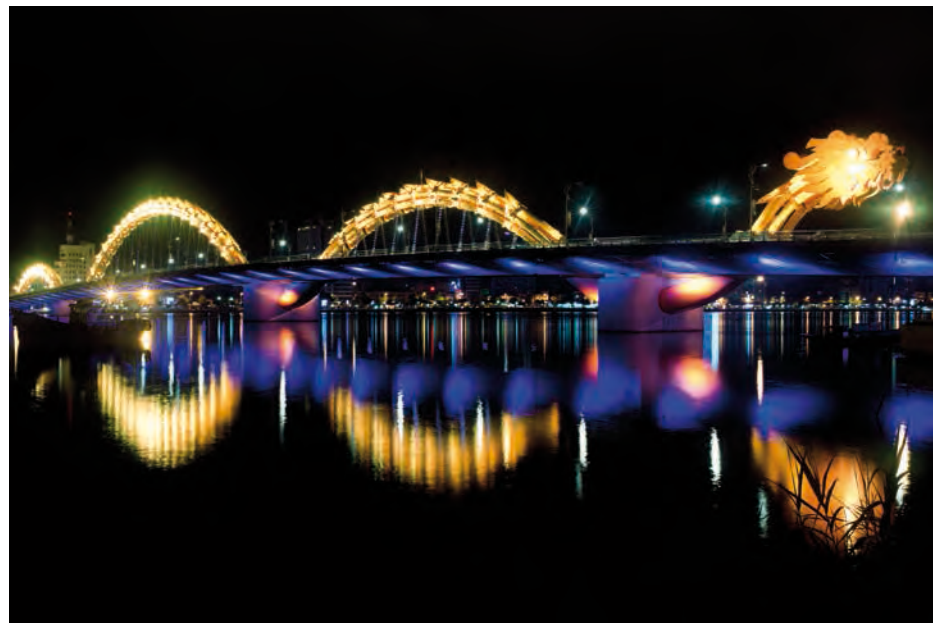
An der Drachenbrücke in der vietnamesischen Hafenstadt Da Nang sorgen 2.500 LEDs von Philips jede Nacht dafür, dass der Drache regelrecht lebendig erscheint.

Besuchen Sie die neue Digital-Storytelling-Plattform von Philips unter www.philips.com/innovationandyou .